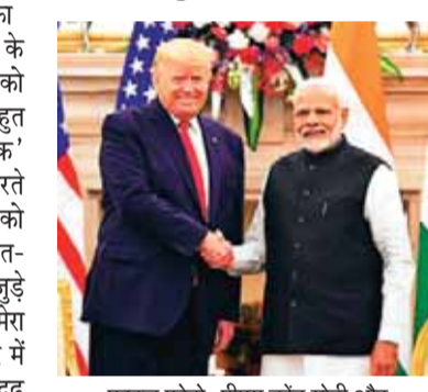
फाइल फोटो: पीएम नरेंद्र मोदी और अमेरिकी राष्ट्रपति डोनाल्ड ट्रंप