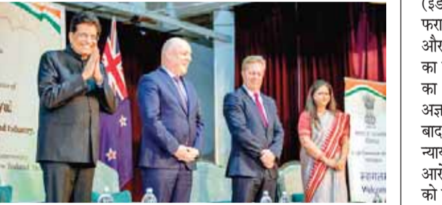
आँकलैंड में वाणिज्य मंत्री पीयूष गोयल, न्यूजीलैंड के पीएम क्रिस्टोफर लकसन