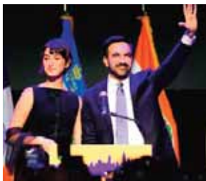
जोहरान ममदानी ने बुधवार को जना को संबोधित किया

अपनी जीत के बाद अपनी पहली एक्स पोस्ट में ममदानी ने एक वीडियो पोस्ट किया, जिसमें सिटी हॉल में एक न्यूयॉर्क मेट्रो ट्रेन खुलती दिखाई दे रही थी और दीवार पर 'जोहरान फॉर न्यू यॉर्क सिटी' लिखा हुआ था। सिटी हॉल वह जगह है, जहां मेयर कार्यालय स्थित है। जोहरान ममदानी ने डेमोक्रेटिक प्राइमरी में पूर्व गवर्नर कुओमी को हराया, जबकि रिपब्लिकन उम्मीदवार स्टीवा ने नाम नहीं वापस लिया। अमेरिकी राष्ट्रपति डोनाल्ड ट्रंप और एलन मस्क की मारी आलोचना के बावजूद डेमोक्रेटिक उम्मीदवार को चुनाव में सफलता मिली।